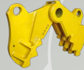
Kit Frantumatore Pulverizer / Broyeur