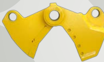
Kit Cesoia Shear / Cisaille