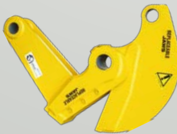
Kit Lamiera Shear / Cisaille