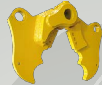
Kit Pinza Crusher / Pince