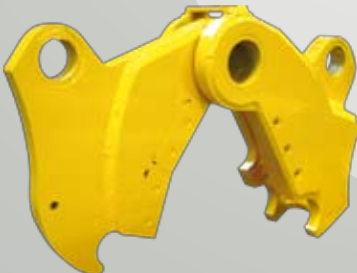
Kit Combi-Cutter Combi-Cutter / Combi-Cutter